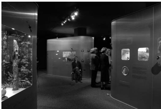
Abb. 6. Die Ausstellung «Zum Kuckuck!» im Natur-Museum Luzern, die zu Beginn der Ala-Mitgliederversammlung besichtigt wurde, ist eine Gemeinschaftsproduktion des Schweizer Vogelschutzes SVS/BirdLife Schweiz, der Schweizerischen Vogelwarte Sempach und des Natur-Museums Luzern und wurde am 18. März 2005 eröffnet.