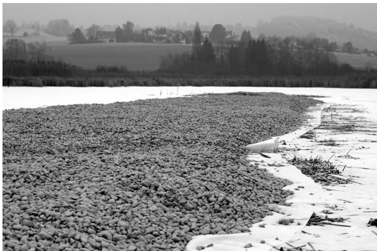
Abb. 5. Die Eisbildung im Neeracherried erlaubte es, die Inseln in der grossen Lagune mit einer Kiesschicht zu sanieren.

Landschaftsschützer nötig, um das damalige Projekt einer Raststätte zu stoppen. Die Stiftung Lauerzersee und die Ala sind der Meinung, dass eine solche Anlage nicht mehr rechtskonform ist.