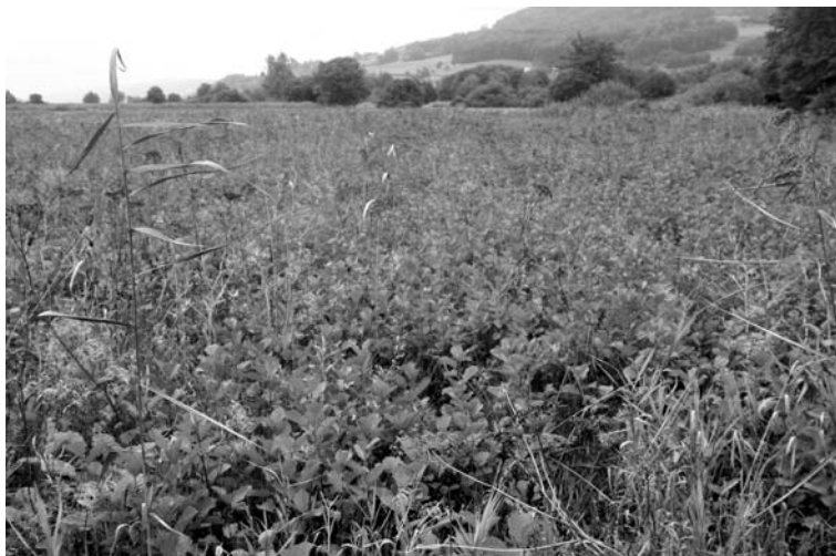
Abb. 4. Ala-Reservat Boniswiler Ried 2005.

Hilfe zu erhalten! (Der Landbesitz der Berner Ala im Wengimoos ist in Abb. 3 dargestellt.)