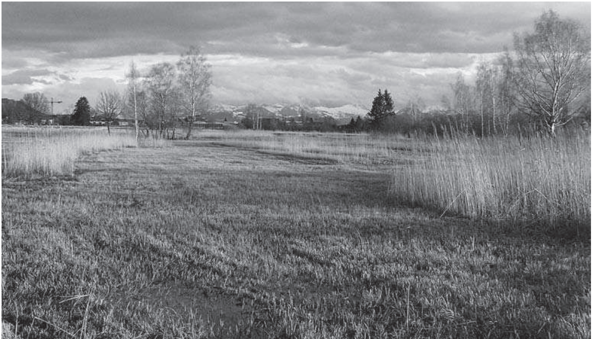
Abb. 9. Müliriet am Pfäffikersee.