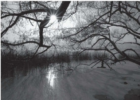
Abb. 3. Im Ala-Schutzgebiet Boniswiler Ried am Hallwilersee.

Brutvögel: Zwergtaucher 2, Schwarzhalstaucher 0, Haubentaucher 13, Graugans 1, Kolbenente 3, Reiherente 12, Gänsesäger 4, Baumfalken 1, Wasserralle 1, Teichhuhn 2, Kleinspecht 1, Mönchsmeise 2, Feldschwirl 2, Sumpfrohrsänger 4, Teichrohrsänger 7, Fitis 1, Rohrammer 5.