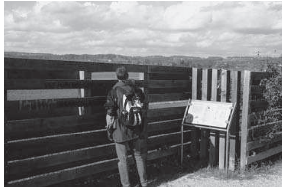
Abb. 7. Die spezielle Beobachtungswand als Sichtschutz am Frauenwinkel.

Brutvögel: Zwergtaucher 2, Haubentaucher 81,