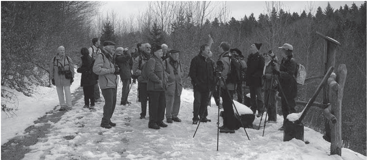
Abb. 11. Eine der Exkursionsgruppen auf dem verschneiten Winterthurer Eschenberg.