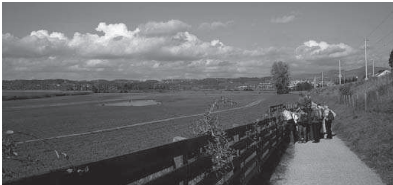
Abb. 8. Besuchergruppe im Frauenwinkel. Die Lenkungs-massnahmen haben sich bewährt.

Brutvögel: Haubentaucher 49, Graureiher, Schwarzmilan, Rotmilan, Teichhuhn 2, Kuckuck 1, Kleinspecht 1, Braunkehlchen 0, Schwarzkehlchen 2, Sumpfrohrsänger 68, Teichrohrsänger 36, Drosselrohrsänger 1, Fitis 2, Neuntöter 2, Rohrammer 36.