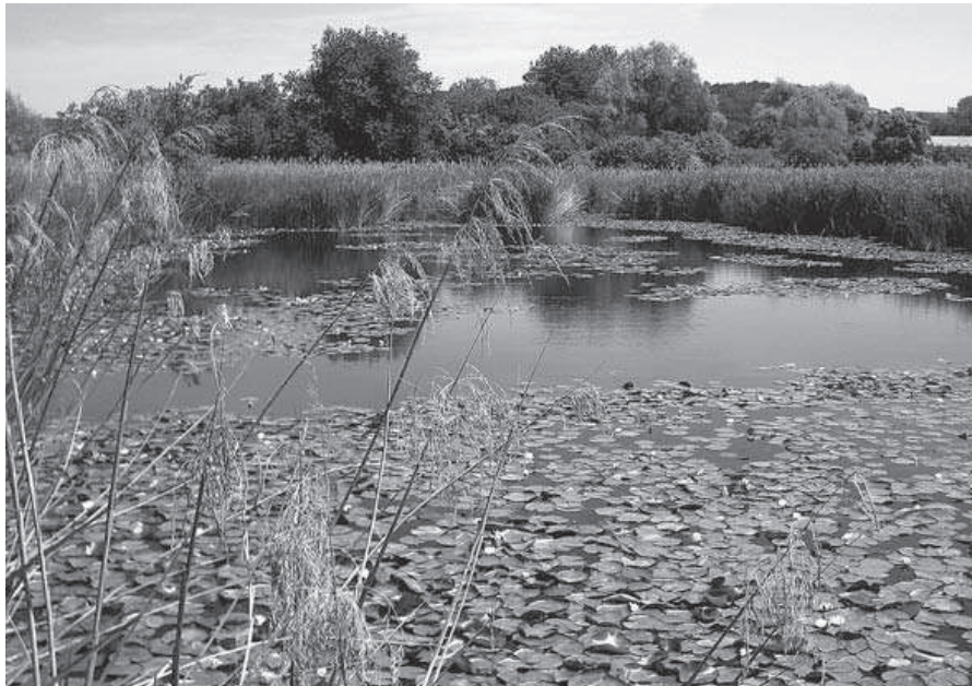
Abb. 2. Fräschelsweiher.