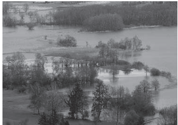
Abb. 5. Überschwemmtes Boniswiler Ried im Frühling 2006.