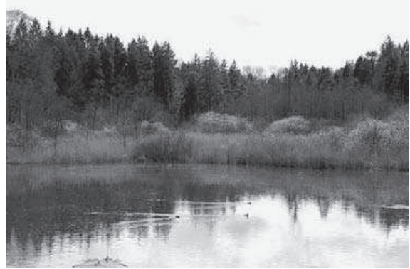
Abb. 4. Gerlafinger Weiher.

Brutvögel: Zwergtaucher 3, Wachtel 1, Wasserralle 6, Teichhuhn 8, Kuckuck 1, Feldschwirl 2, Sumpf-