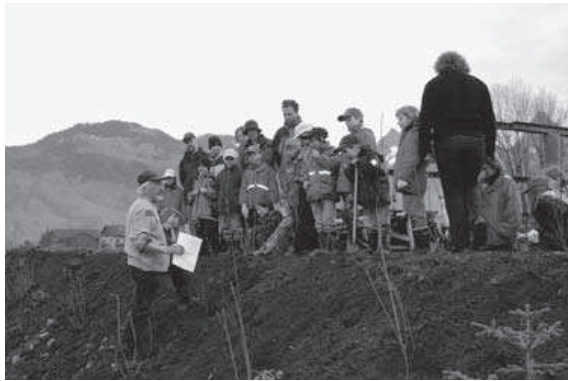
Abb. 6. Die Jugendnaturschutzgruppe Goldau und Schwyz pflanzt am Lauerzersee eine randliche Hecke.