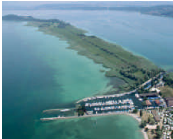
Abb. 5. Heideweg und St. Petersinsel, von Erlach im Vordergrund etwa Richtung ENE. Linke Aufnahme 17. August 1987. Rechte Aufnahme 9. Juli 2010.