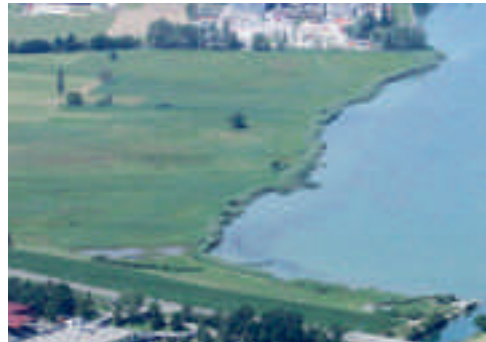
Abb. 7. Frauenwinkel, Gebiet Inner Sack, links Pfäffikon (Kanton Schwyz) Richtung NW. Im rechten Bild ist unten der Beginn des Durchstichs durch den Seedamm erkennbar. Beide Aufnahmen W. Müller, 22. September 1987 bzw. 12. Juli 2010.