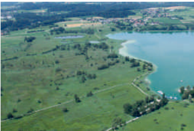
Abb. 10. Pfäffikersee, Robenhäuserriet. Blick Richtung WSW gegen Seegräben und Auslikon. Beide Aufnahmen W. Müller, 22. September 1987 bzw. 12. Juli 2010.