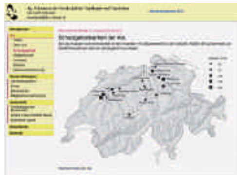
Abb. 3. Startseite zu den Ala-Schutzgebieten unter www.ala-schweiz.ch .

Das Reservatsteam erarbeitete die Grundlagen, damit die Schutzgebietsbetreuung in Zukunft basierend auf fachlichen Grundlagen und Inventaren mit differenzierten Pflegeplänen erfolgen kann. Dieses Vorgehen wurde mit den Betreuerinnen und