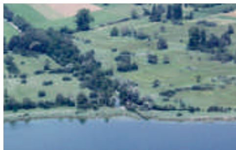
Abb. 11. Greifensee, Glattausfluss. Blick in Richtung NW, rechts oben Schwerzenbach. Beide Aufnahmen W. Müller, 22. September 1987 bzw. 12. Juli 2010.

Ergebnisse werden erst im Frühling 2011 vorliegen. Die neuen Schutzbestimmungen, welche sich aus der Wasser- und Zugvogelreservatsverordnung (WZVV) des Bundes ergeben, wurden von der Jagd- und Fischereiverwaltung, der Fachstelle Naturschutz, der Ala und dem SVS/BirdLife Schweiz mit den Gemeinden im Detail besprochen. Sie sollen mit neuen Markierungen bekannt gemacht werden. Erstmals soll ab Frühling 2011 ein Ranger die Umsetzung der Schutzbestimmungen gemäss WZVV, vor allem die Leinenpflicht in den Übergangsf lächen zwischen Neeracherried und Neerersee, durchsetzen helfen.