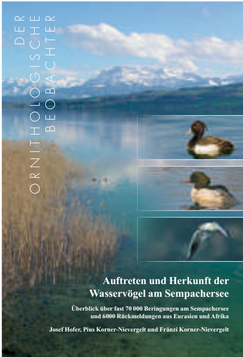
Abb. 2. Titelblatt des Beihefts 11 des Ornithol. Beob.

insgesamt 46 Bücher und vier Datenträger besprochen wurden, und einen Nachrichtenteil, das Juniheft zudem die Jahresberichte von Ala und Vogelwarte. Der Band war mit 304 Seiten und einem 12-seitigen Index wieder deutlich schmaler als die beiden seitenstarken Vorgänger, liegt aber im Bereich der Bände zuvor.