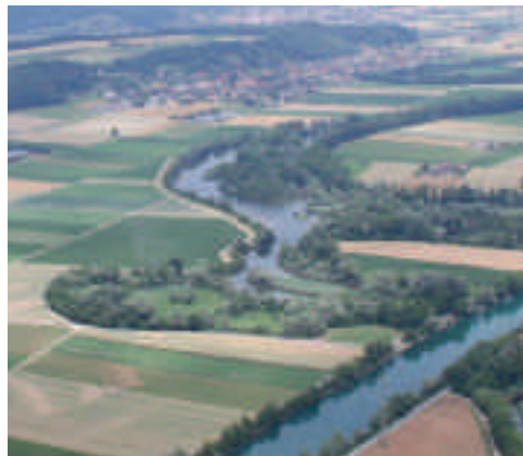
Abb. 6. Häfli bei Büren. Blick in Richtung NW auf den Zusammenfluss der Alten Aare und der alten Zihl, rechts im Bild der Nidau-Büren-Kanal. Linke Aufnahme 17. August 1987, D. Forter und H. Flury. Rechte Aufnahme 9. Juli 2010, W. Müller.

Der südliche Waldrand bei der Kanincheninsel wurde ausgelichtet.