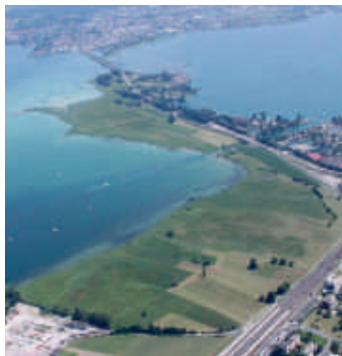
Abb. 9. Frauenwinkel und Seedamm, Blick Richtung NE, im Hintergrund Rapperswil (Kanton St. Gallen). Aufnahme 12. Juli 2010, W. Müller.

Das Brutfloss auf der Ostseite des Sees wurde, nachdem es unbenutzt geblieben war, im Frühling 2010 in der Nähe des bestehenden Flosses in der Herdplattenbucht neu verankert – mit Erfolg.