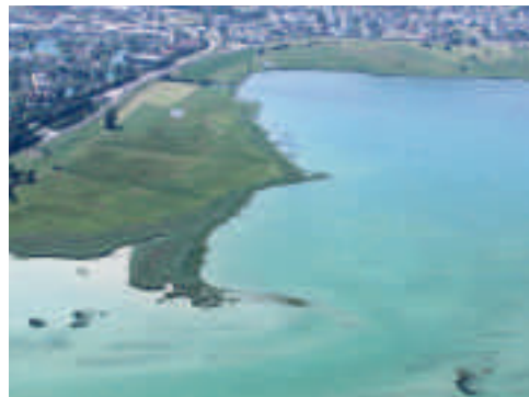
Abb. 8. Frauenwinkel mit Üsser Sack, Inner Sack und den Untiefen gegen die Inseln Ufenau und Lützelau. Blick Richtung SSW, im Hintergrund Pfäffikon (Kanton Schwyz). 22. September 1987 bzw. 12. Juli 2010.

Das Entwicklungskonzept für den Lauerzersee ist ins Stocken geraten. Die vielen Einsprachen von Grundeigentümern müssen behandelt werden. Die Schutzverordnung aus dem Jahr 1987 muss verbessert werden.