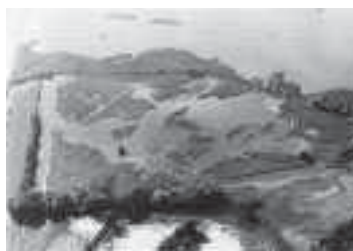
Abb. 4. Fanel. Oben links Blick Richtung WNW, 17. August 1987, 3 Monate nach Fertigstellung des Graben-Teich-Systems. Aufnahme D. Forter und H. Flury. Rechts Blick Richtung ESE, vorne die Neuenburger Insel. Aufnahme 9. Juli 2010, W. Müller.

Zusätzlich standen beim Reservatsteam folgende Arbeiten im Vordergrund: Wirkungskontrolle Moorschutz in vier Ala-Reservaten mit neuem Vertrag und Vergrösserung des Landbesitzes. Zudem haben wir von einigen Ala-Schutzgebieten neue Luftaufnahmen angefertigt, die interessante Vergleiche mit den ähnlichen Aufnahmen von 1987 ermöglichen.